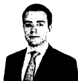
Николай Анатольевич Никифоров

Министр связи и массовых коммуникаций Российской Федерации